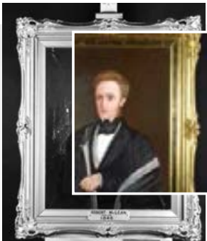
Portrait des Bürgermeisters Robert McLean (1846), 2018 restauriert.