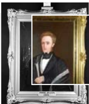
Retrato del alcalde Robert McLean (1846), restaurado en 2018.